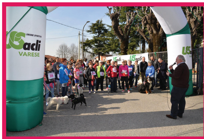
4 ^ corsa delle donne 2017

Ancora un buon successo della "Corsa delle donne", alla sua quarta edizione, con partenza dall'oratorio di San Pietro e Paolo di Quinzano di Sumirago. Il clima primaverile di Domenica 12 marzo ha salutato anche quest'anno questo evento sportivo, che ha visto la presenza di oltre 250 partecipanti di ogni età. Percorso di 4 km per le atlete maratonete di corsa e itinerario breve di Km 2,2 per chi ha voluto godersi il percorso tra le vie di Quinzano a passo lento. Durante la manifestazione è stato raccolto un contributo destinato all'istituto "Mater orphanorum" di Comabbio, che segue minori in difficoltà, confermando in questo modo lo spirito di solidarietà che contraddistingue da sempre l'attività dei Runners.