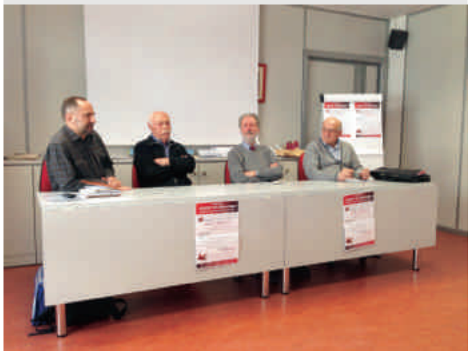
Conferenza stampa di "Immigrazione e Salute".

Nato nel marzo del 2009, come progetto dell'Associazione di Volontariato "I Colori del Mondo Onlus", l'ambulatorio per migranti e senza fissa dimora è stato pensato per dare assistenza sanitaria a tutti coloro che non sono iscritti al Servizio Sanitario Nazionale e che, grazie all'impegno di un gruppo di volontari e volontarie, medici, psicologhe, infermiere, accompagnatori e con il sostegno di numerose Associazioni varesine, ha dato vita ad un esperimento di libera assistenza sanitaria ambulatoriale, di orientamento e/o accompagnamento verso i servizi sanitari pubblici o privati del territorio.