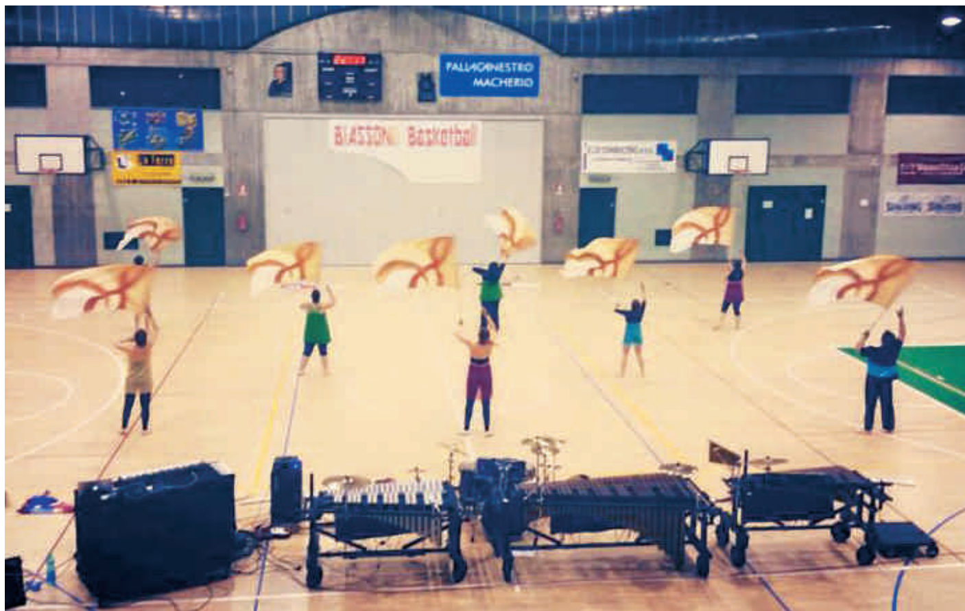
Le Color Guard dell'Associazione ANIMA .

A ssociazione ANIMA è: Organizzazione di eventi - ideazione, compartecipazione ed organizzazione di eventi musicali, culturali, formativi, e a sfondo sociale; academy - organizzazione e gestione di corsi di formazione musicale; Drum Corps - approfondimento della cultura bandistica in stile "marching" e coreografico. Propone nell'ambito della programmazione eventi 2015, la manifestazione artistico-sportiva dal titolo " Mille e una danza ", che