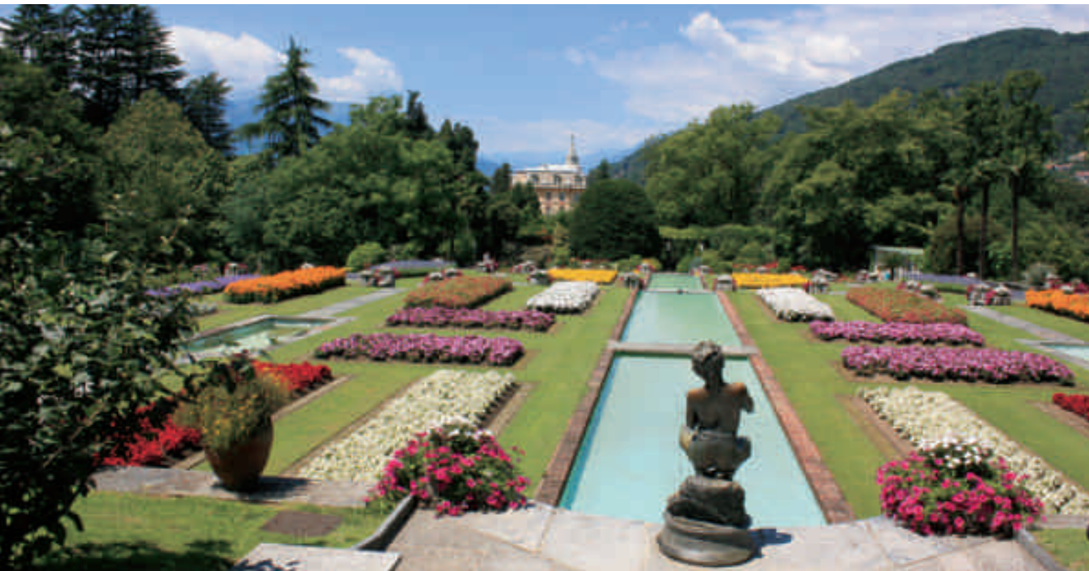
Gli splendidi giardini di villa Taranto - Verbania Pallanza

Come è ormai consuetudine da diversi anni, la convocazione dell'Assemblea annuale dei soci Aval viene integrata da una proposta di turistico ricreativo che completa la giornata unendo all'impegno anche una piacevole opportunità per trascorrere alcune ore insieme in un contesto di convivialità e di amicizia.