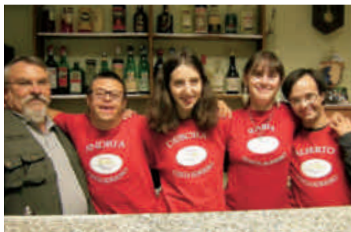
I quattro dolcissimi volontari del Circolo di Voldomino.